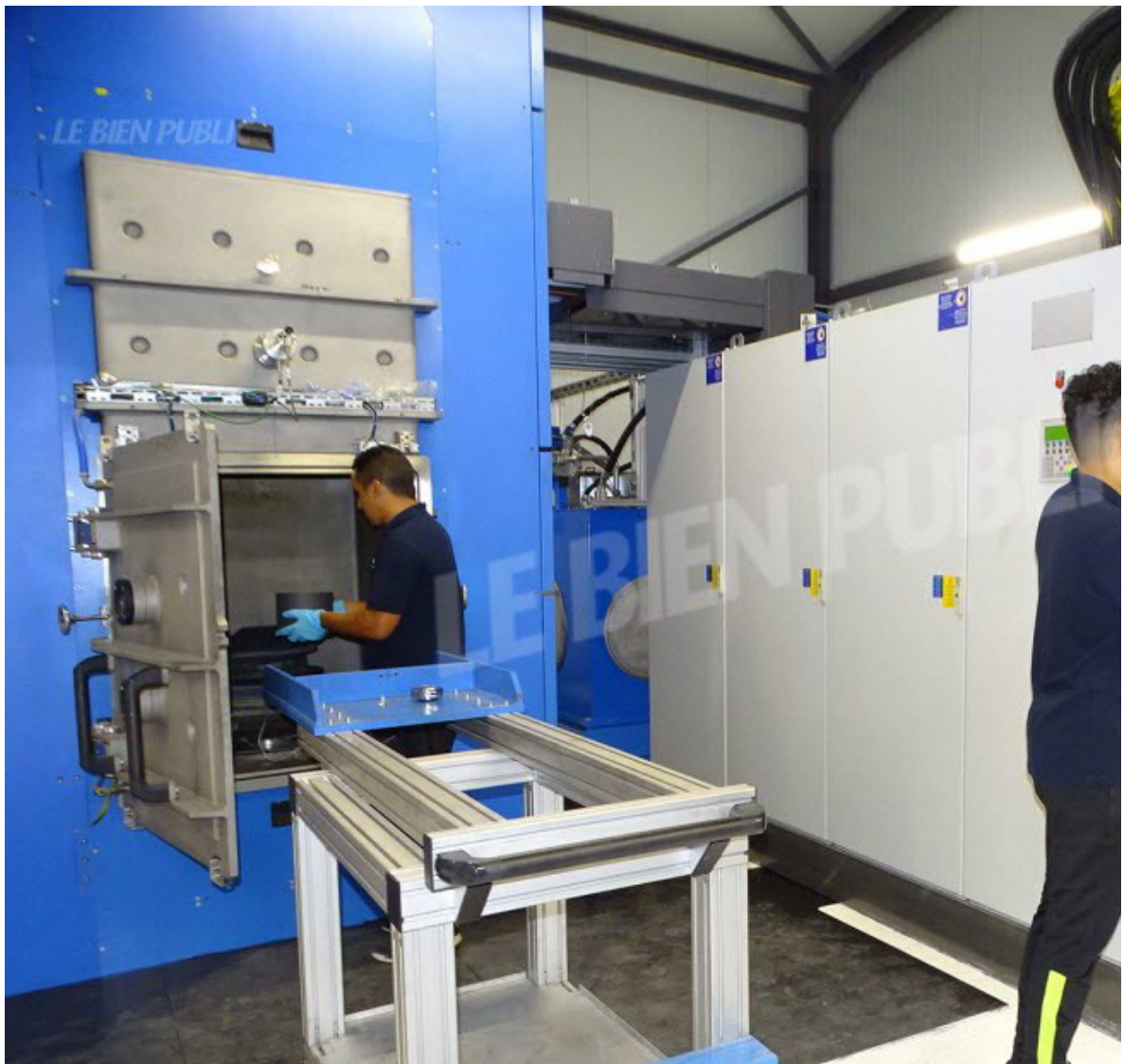
■ Installation d'un outillage dans le four de la machine du frittage.