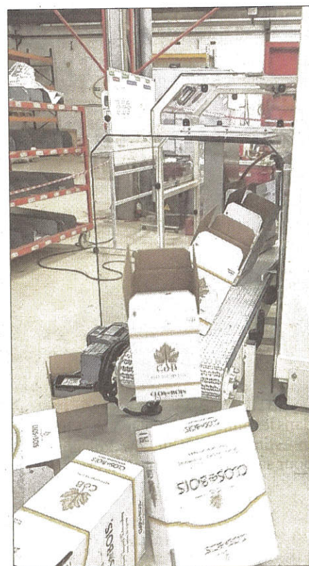
■ Cette machine envoie environ quarante emballages en carton ondulé et 100 % recyclé par minute.