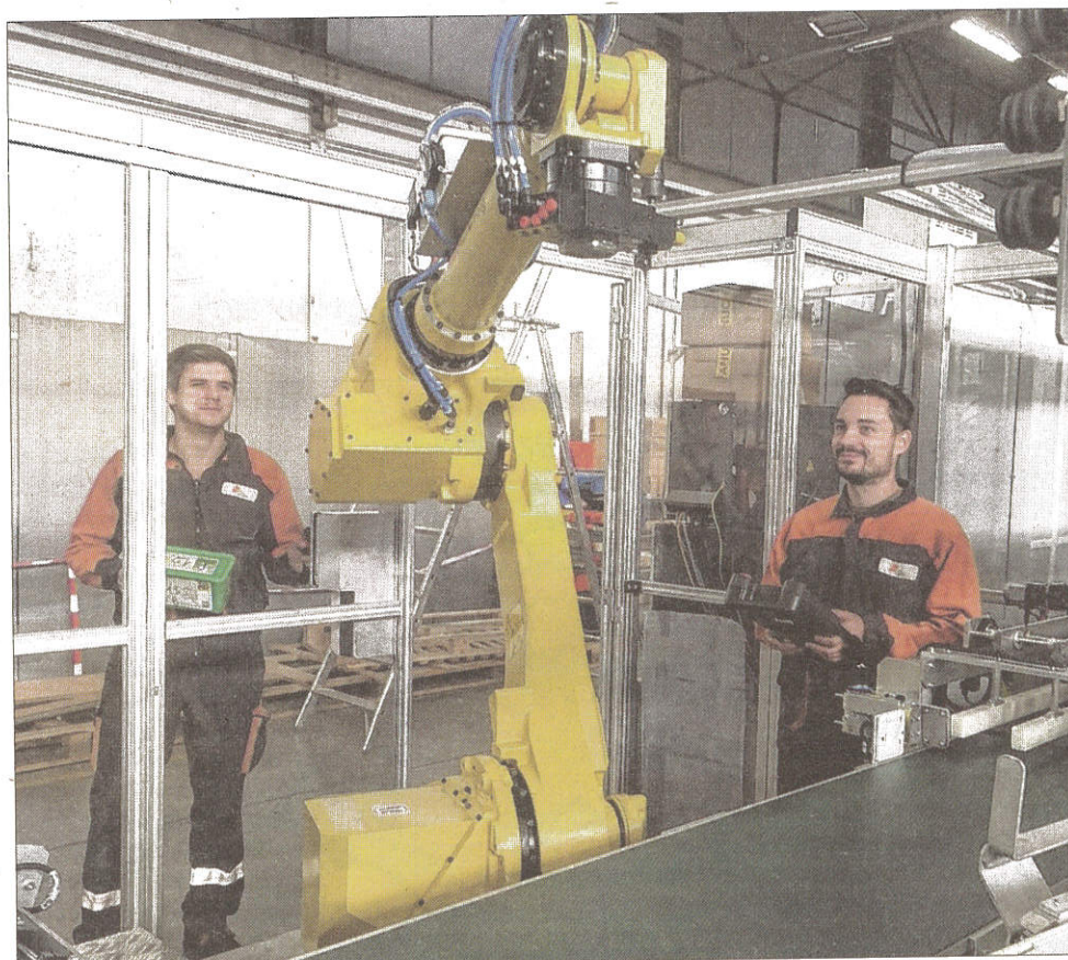
■ Ce robot d'encaissage fait partie d'une ligne complète de 350 m 2 pour produits vaisselle. Les techniciens préparent les robots afin d'organiser une réception technique avec les clients.