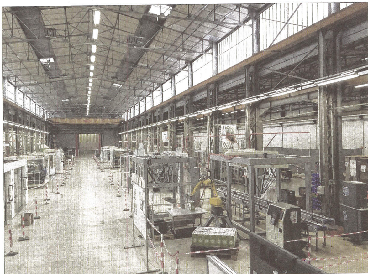
■ L'atelier de l'usine de Chenôve s'étend sur 5 000 mètres carrés.